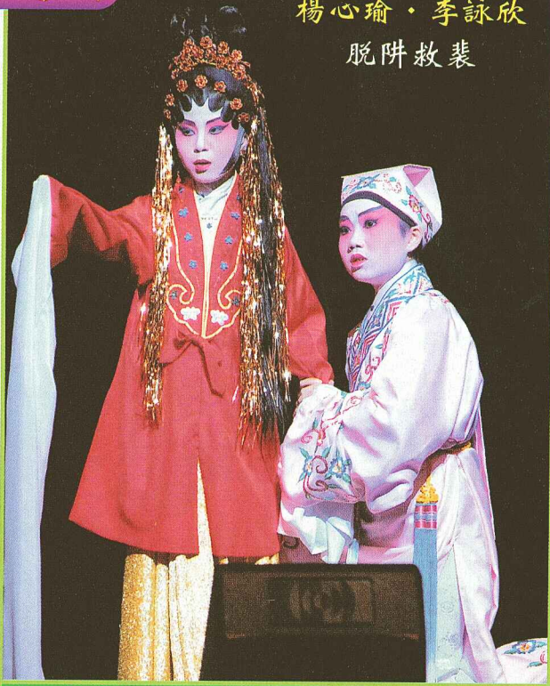
“脫阱救裴”，不足九歲的花旦，演來純熟