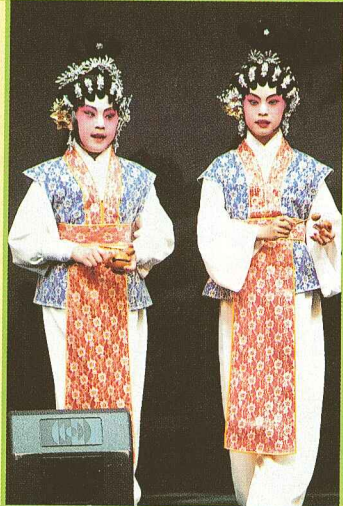
一對「數白攬」的姊妹，交足功課