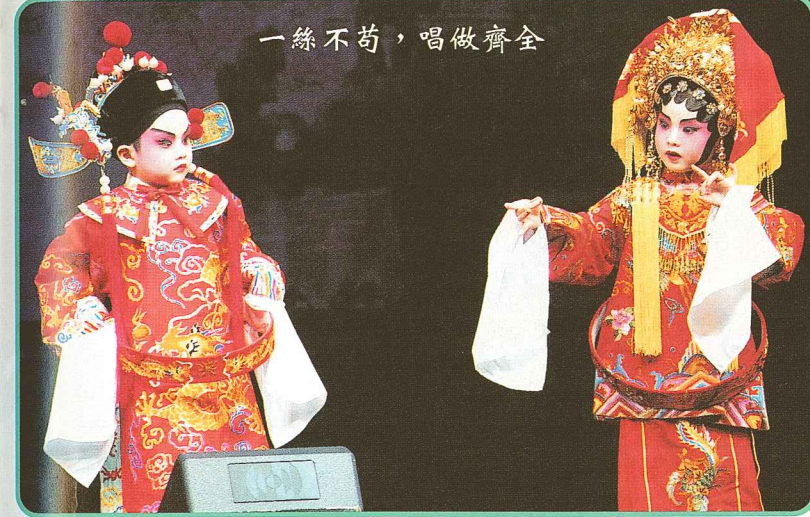
一絲不苟，唱做齊全