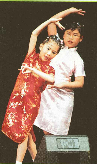
組合獻唱，看來要多習交流