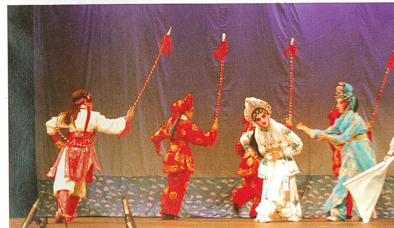
《白蛇傳》之《水漫金山》(演出：聲輝兒童/少年粵劇團)。