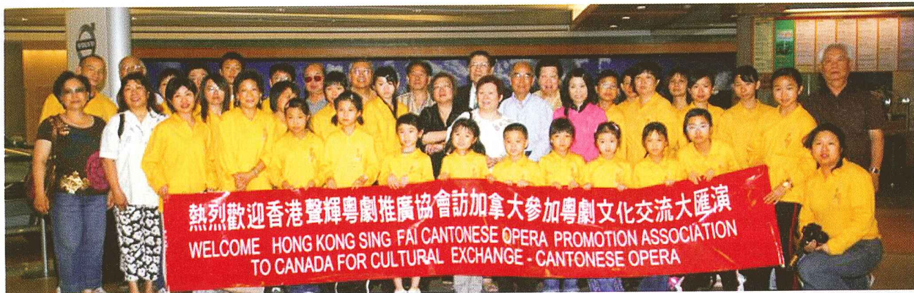
到達點問頓機場，主辦機構熱烈歡迎。