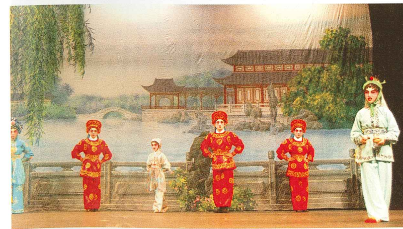
「查篤撐」(英語粵劇) (演出：聲輝兒童/少年粵劇團)。